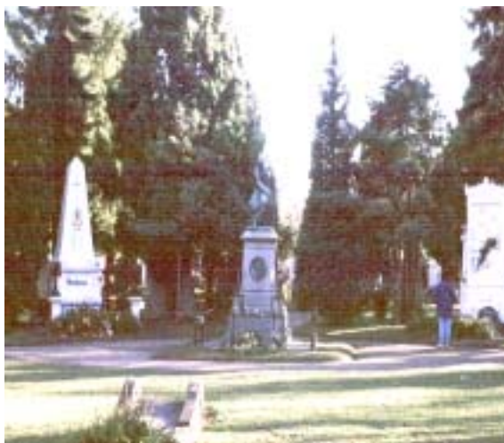
Typisch Friedhof: Nadelgehölze als Rahmenpflanzung