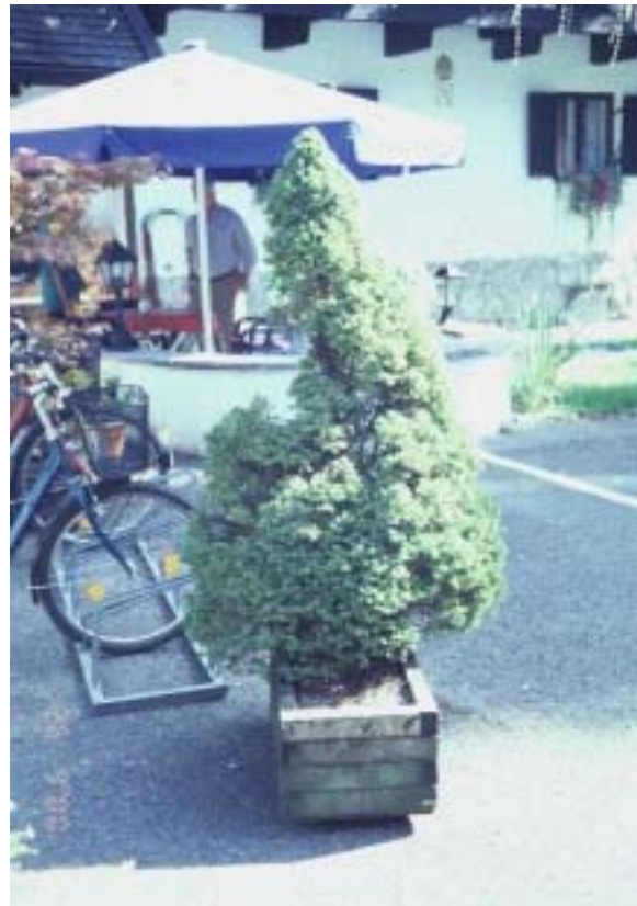
Nadelgehölze in Pflanzgefäßen sind meistens zu bedauern.