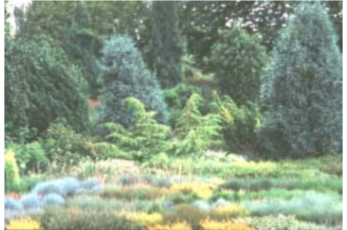
Schön bunt: interessante Kombination mit Nadelbäumen, Zwerggehölzen und Gräsern