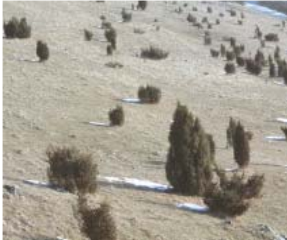
Landschaftsbildprägend: Der Wacholder blieb nach Beweidung stehen.