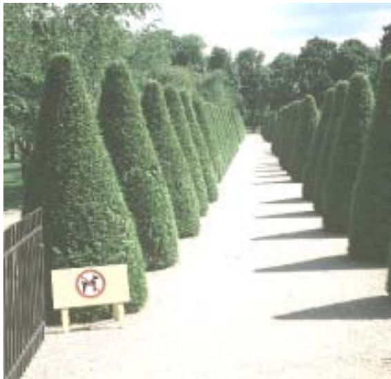
Nadelgehölze mögen keinen Hundeurin: Eiben ( Taxus baccata )